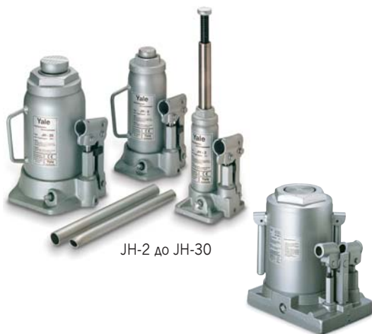
JH-2 до JH-30