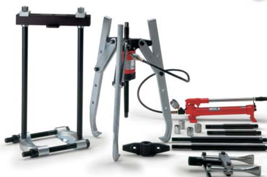
YHP-2751 G YHP-3751 G YHP-5751 G