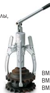
BMZ-6 BMZ-8 BMZ-11